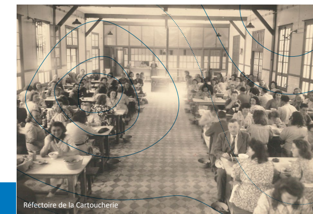
Réfectoire de la Cartoucherie

Départ de visite guidée à 14h30. Durée environ 3h. Inscription obligatoire au 01 34 09 01 02 ou sur le site Internet du musée ARCHÉA. Pièce d'identité obligatoire pour entrer dans l'enceinte d'Autoliv NCS.