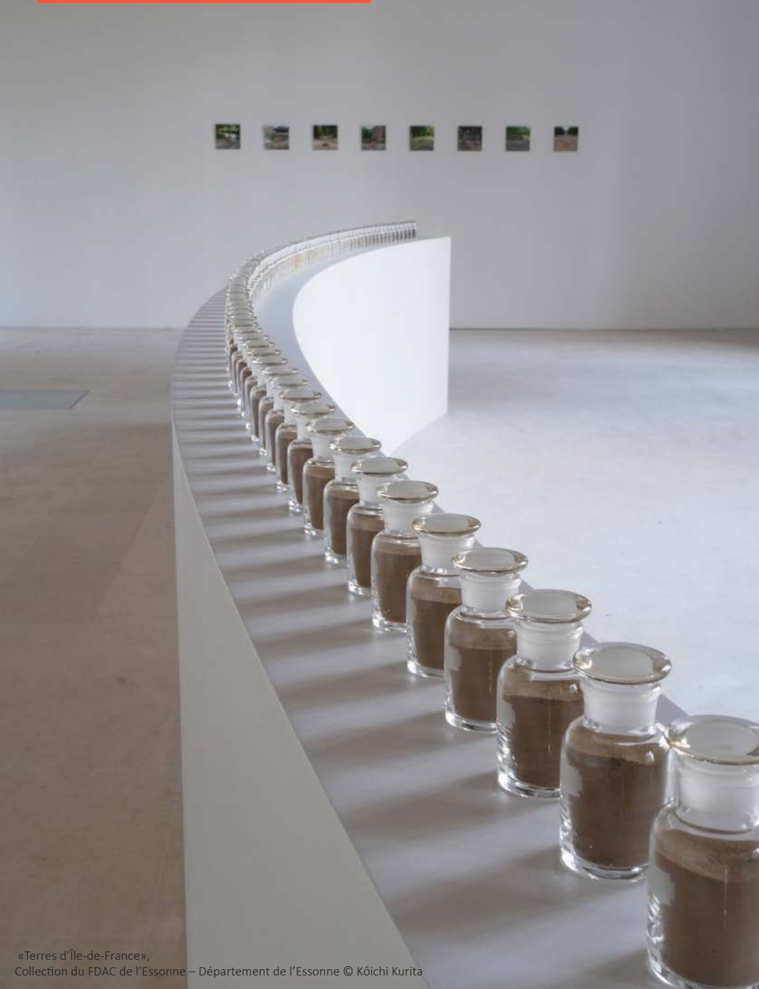
«Terres d'Île-de-France», Collection du FDAC de l'Essonne – Département de l'Essonne © Kôichi Kurita