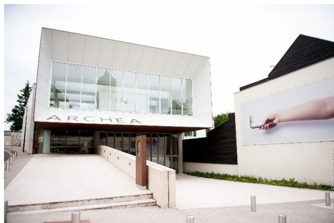
Musée intercommunal ARCHÉA, à Louvres (Val-d'Oise)