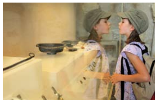
Les animations se déroulent au musée situé au 56 rue de Paris à Louvres (sauf mention contraire)